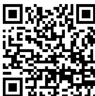
研討會官方網站 QR Code